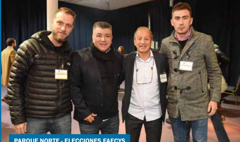
PARQUE NORTE - ELECCIONES FAECYS

nuestros afiliados tiene que sentir orgullo de que sus dirigentes estén sentados en la mesa de las grandes discusiones. Lo que hemos logrado en el SECLA , gracias al esfuerzo de todos y en tan poco tiempo, llama la atención a muchos.